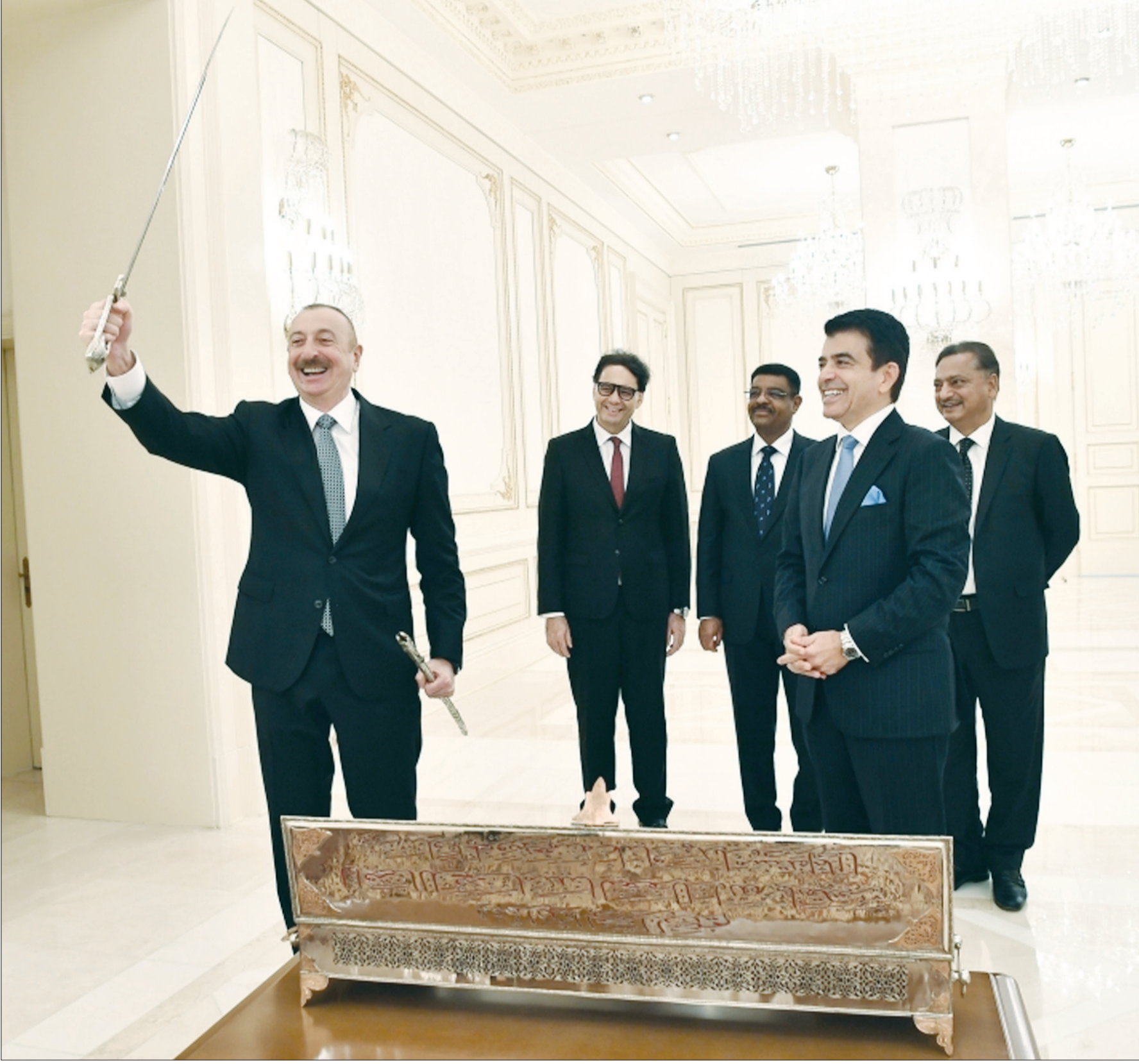
İlham Əliyev, Azərbaycan Respublikasının Prezidenti